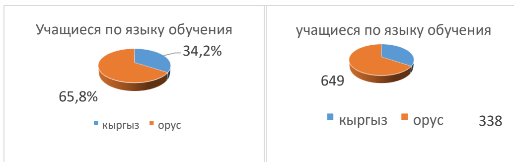
1. Статистические данные школы 2. Статистические данные школы

За последние 5 лет наблюдается спрос к русскоязычным классам со стороны родителей села Баетово. Например, в 2021/2022-учебном году всего было принято в первый класс 92 ученика, и все учащиеся были зачислены в русский класс по желанию родителей.