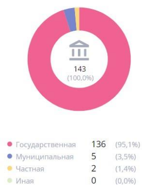
По форме собственности