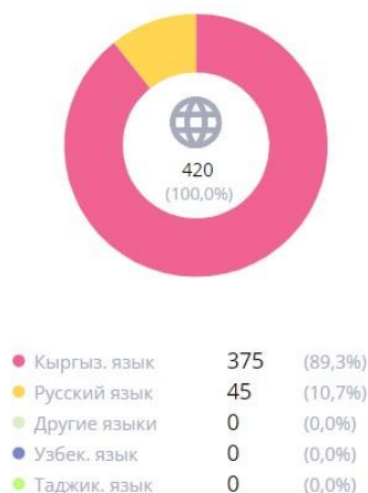
Рисунок 3.

Я работаю в средней инновационной школе имени Шукурбека Бейшеналиева с 2019года. Статистические данные этой школы: