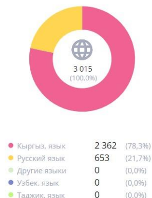
Рисунок 1. Источник: https://emis.edu.gov.kg/ Рисунок 2. Источник: https://emis.edu.gov.kg/

Всего 143 школ, из них 136 государственных и 5 муниципальных. В этих школах можно увидеть, что 2362 класс - комплекта обучаются на кыргызском, 653 класса с русским языком обучения. В Нарынской области можно считать, что школ с русским языком обучения - нет (кроме Чкалова), есть классы с русским языком обучения.