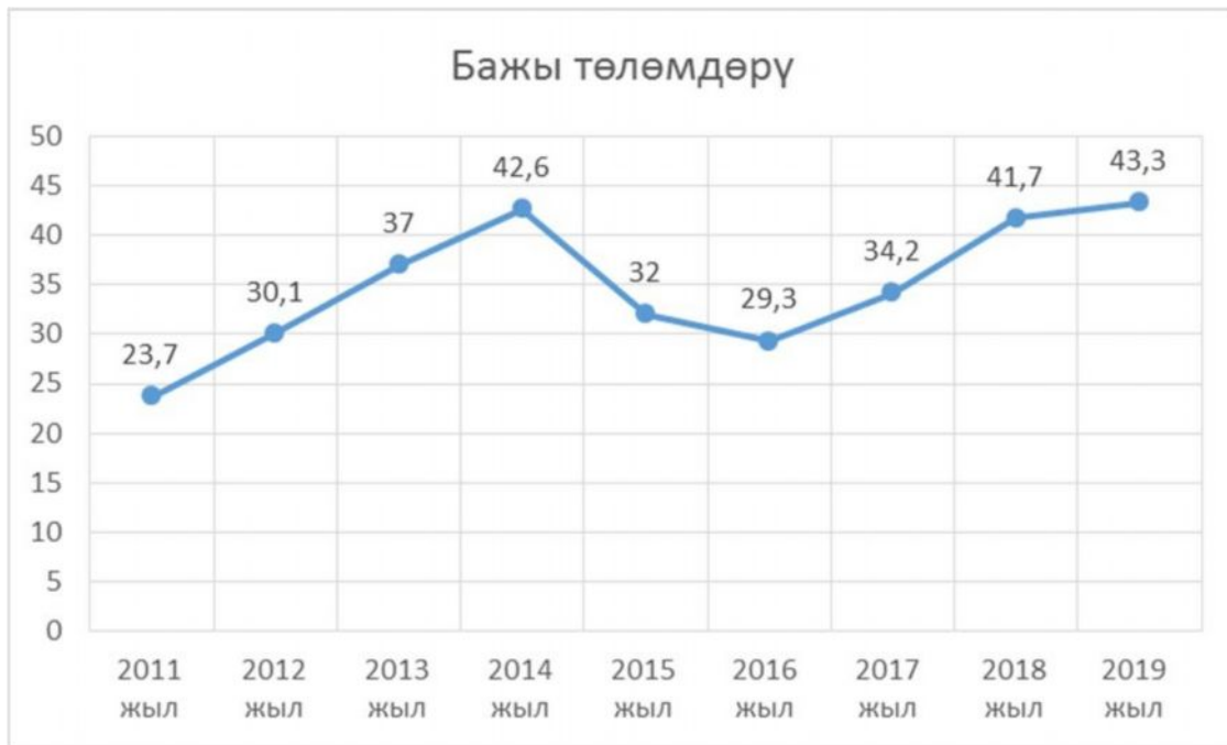
2- сүрөт. Бажы төлөмдөрүнүн мамлекеттик казынасына 2011-2019жылдарда түшкөн көрсөткүчтөрү (млрд сом менен)

квитанцияларын аэропортто учакка олтураардын астында бажы органдарынын кызматкерлерине көрсөткөн болсоң, товарларыңды жана алардын квитанцияларын текшерип, андагы алынган салыктын, пошлиналардын суммасын сизге акчалай кайтарып берет. Бул туура принцип. Себеби товар ал мамлекетте колдонбой туруп чыгып бара жатат. Ошол үчүн бажы ишинде атайын «бажы кампасы» деген жол – жобо бар, эгерде товар мекендеш ишкерлерибиз аркылуу чет мамлекеттен товар алынып келинип, ушул «бажы кампасы» жол – жобосуна салынып, кайра «реэкспорт» жол – жобосу менен мамлекетибиздин бажы территориясынан чыгарылып кетсе, киргенде да, чыкканда да эч кандай бажы пошлиналары жана салык төлөмдөрү төлөнбөйт.