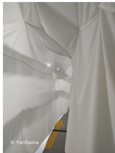
Рисунок 3 – Инсталляция посвящена проблеме таяния ледников. Культурный центр «Кудук»

Общество, не обращающее внимание на экологию, развивается в неправильном направлении: сохранение природы перерастает в проблему выживания. Осознание человечеством проблемы восстановления баланса «я – природа» может снять напряжение во взаимоотношениях между обществом и окружающей средой. Изменение климата – не миф, а таяние ледников – это экологическая проблема. Ледники являются базой данных о климате прошлого, слои ледника хранят информацию сотни тысяч лет. Экоарт-выставка «Кондиционер не работает» продемонстрировала и дала почувствовать последствия изменения климата. Одни из самых ярких впечатлений – рукотворный тоннель в «сердце ледника» (рисунок 3) и звук капающей воды – дали возможность посетителям почувствовать, что «вечный лёд» оказался хрупок перед современной цивилизацией, что даёт понимание о неизбежности перемен. Экоарт-выставка – это мероприятие, где идёт визуализация переживаний и мыслей различных