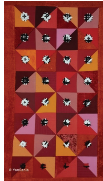
Рисунок 1 – Курак в технике каттама. Маншук Есдаулет

В современном искусстве работы в технике пэчворк (кырг. – курак) входят в фонды исторических и этнографических музеев, музеев декоративно-прикладного искусства, так как (лоскутное шитье) «проделало долгий путь от метода декорирования национального костюма и убранства до референса для европейского авангарда, плодovitого художественного медиума и тенденции в дизайне одежды, достойной стать музейным экспонатом» [3]. Выделяются традиционные виды: предметы убранства жилища, костюмы и детское приданое. В технике экоарт художники обращаются к лоскутному шитью в интересах