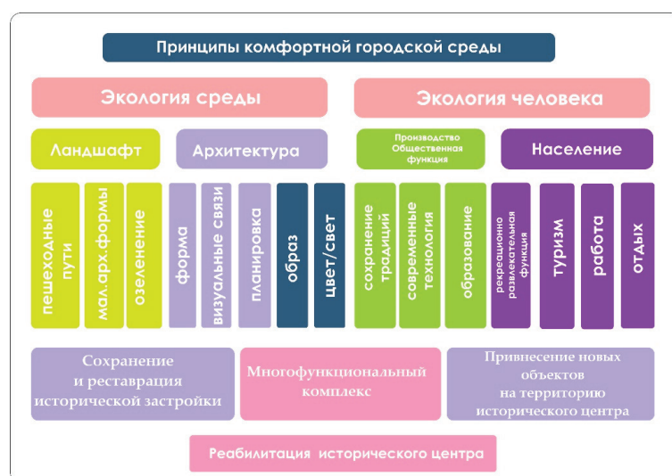
Рисунок 3 – Принципы организации комфортной городской среды

населения город, с многочисленными промышленными предприятиями, утопал в зелени, а развитая сеть каналов и арыков, создавала благоприятный микроклимат на улицах даже в самое жаркое время года. Камерные, пропорциональные и соразмерные общественные пространства создавали гармоничную среду для отдыха и повседневного пребывания горожан. “Экстенсивное развитие города в последние два десятилетия “постсоветского” периода, окончательно подорвало его инфраструктуру” [3, с. 85]. Современная архитектурная среда общественных пространств характеризуется, прежде всего, отсутствием необходимого единства при сочетании новой точечной застройки с существующими зданиями и дисгармонирует с уникальными пейзажами и горным обрамлением. Основной проблемой является исчезновение облика столичного города. “Архитектура невыразительна, использование современных материалов, колористика и отделка зданий не отражают особенностей национальной архитектуры” [4, с. 17]. Утрачены тенистые бульвары, ушли в прошлое вымытые зеленые улицы, уничтожено большинство парков и скверов. Суровой реальностью городской жизни стали перегруженные автомобилями улицы, отсутствие троуаров, масштабное увеличение площади асфальтового покрытия вместо зеленых насаждений, а также нехватка достаточ-