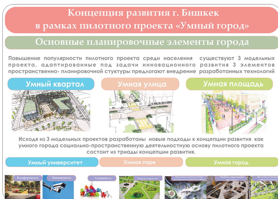
Рисунок 4 – Модель развития общественных пространств г. Бишкек

и поддержание соответствующего качества окружающей среды» [6]. Поэтому создание безопасных и комфортных условий для проведения в жизнь программы “успешный город” дает возможность организации архитектурной среды общественных пространств для проведения досуга, общения, осуществления творческих идей. При этом оно бесплатно и постоянно доступно для населения.