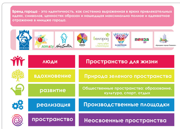
Рисунок 1 – Элементы, составляющие бренд города

облик мультикультурного, мультикулинарного и многонационального туристического центра” [2, с. 23]. Другим ценностным фактором является сохранение визуального обзора на природные доминанты – океан и горы и включение их в городскую ткань общественных центров. Возможность передвигаться пешком, на велосипеде или на общественном транспорте, которая привела к максимальному сокращению использования личного транспорта, стала еще одним немаловажным фактором, повышающим качество