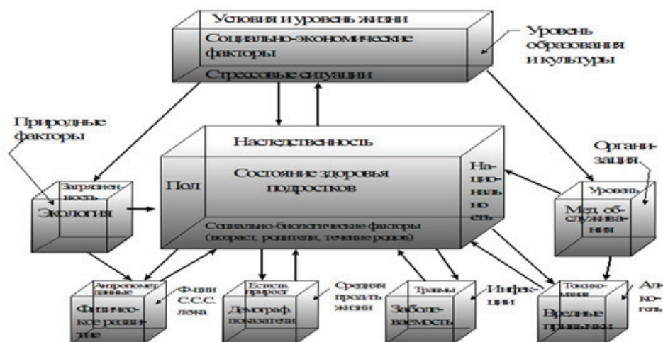
Рисунок 1 – Причинно-следственные факторы, влияющие на состояние здоровья подростков и юношей