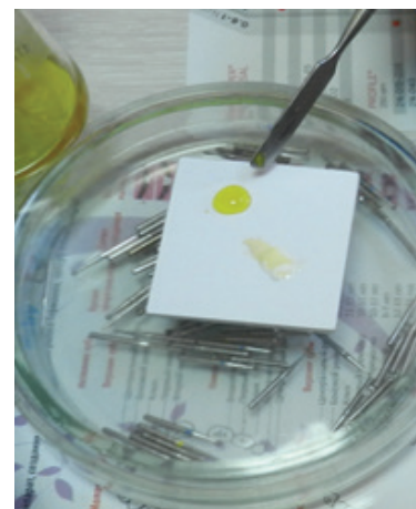
Рисунок 6 – Нанораствор золота

Далее проводили временную obturацию гидроксидом кальция с наложением временной пломбы на 14 дней.