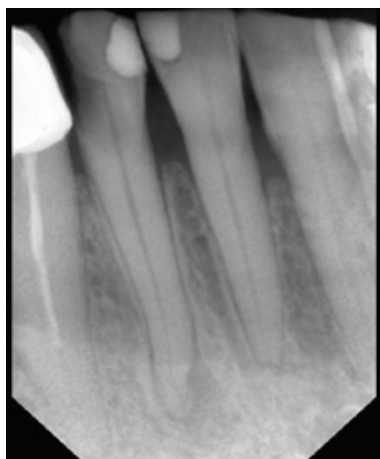
Рисунок 4 – Рентгенологический снимок 4.2 зуба до лечения