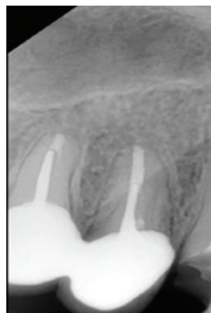
Рисунок 3 – Рентгенологический снимок 2.1 зуба через 12 месяцев после эндодонтического лечения

Лечение: зуб изолирован коффердамом, удалена временная пломба, проведена повторная медикаментозная обработка корневого канала с помощью раствора гипохлорита натрия 3%-го и нанораствора золота с целью удаления остатков гидроксида кальция. После медикаментозной обработки корневой канал высушен с применением пестер со стерильным абсорбером. Далее obturated корневой канал методом латеральной компакции с использованием гуттаперчи и силера AN Plus.