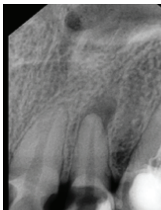
Рисунок 1 – Рентгенологический снимок 2.1 зуба до эндодонтического лечения