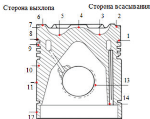
Рисунок 1 – Эскиз поршня с точками замера температуры

На рисунках 2 и 3 приведены графики изменения температуры в характерных точках поршня в зависимости от температуры охлаждающей воды и при соответствующей мощности двигателя.