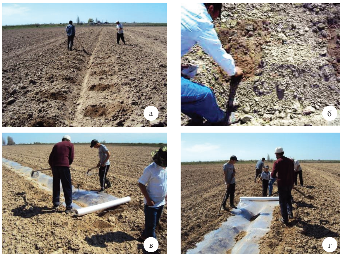
Рисунок 3 – Процесс ручного посева бахчевых культур кыргызстанскими фермерами: а – подготовка лунок для посева семян; б – ручной посев семян; в – натягивание пленки поверх семян; г – закрытие краев пленки

техника не будет соответствовать используемой местной технологии.