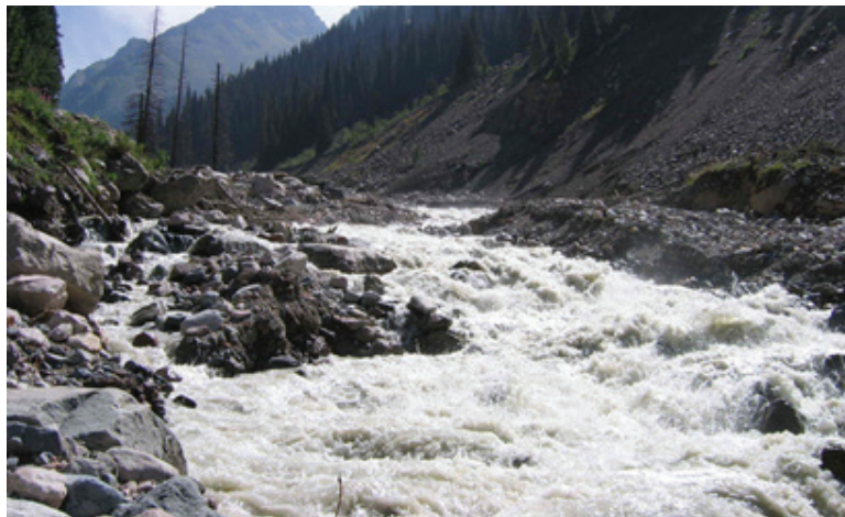
Рисунок 1 – Движение двухфазного потока (вода-наносы) на участке р. Талгар в отмыске, предварительно сформированной паводковыми расходами

Реки Центральной Азии отличаются высокой эрозионной деятельностью и соответственно большей средней годовой мутностью, которая изменяется в широком диапазоне – от 0,01 до 18 кг/м 3 . Наибольшую мутность имеют южные реки. Если мутность северных рек не превышает 0,2–0,3 кг/м 3 , то у южных рек мутность больше 3 кг/м 3 (рисунок 1).