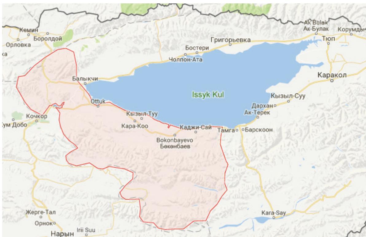
Рисунок 3 – Месторасположение Тонского района Иссык-Кульской области

В Тонском районе, расположенном на южном берегу озера Иссык-Куль, практически круглый год держится солнечная погода и, в отличие от северного берега, зимой редко выпадает снег. Климат на побережье озера Иссык-Куль умеренно-континентальный, теплый, сухой с включением элементов горного и морского климата. Количество часов солнечного сияния составляет в среднем 2700 часов в год, что больше, чем на Черном море. Для сравнения, количество часов солнечного сияния в Москве равно 1600 час в год. Температура воздуха днём в летние месяцы колеблется от +17 до +28 °С [5]. Климат и географическое расположение побережья Иссык-Куля – это те факторы, которые подтверждают возможность использования солнечной энергии для энергоснабжения жилых домов. Поэтому использование фотоэлектрических установок, при определенных экономических условиях, актуально и имеет хорошие перспективы. Фотоэлектрическая установка включает в себя: солнечный модуль; фотоэлектрическую панель; контроллер заряда; аккумуляторную батарею; инвертор (рисунок 4) [4].