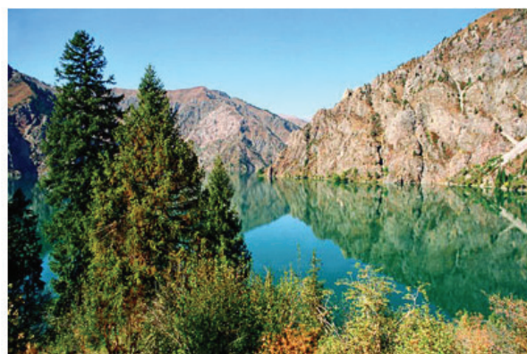
Рисунок 2 – Джалал-Абадская область