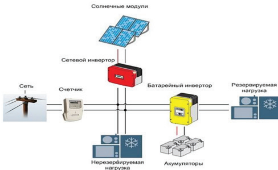
Рисунок 4 – Фотоэлектрическая установка с дублирующим источником энергии из сети