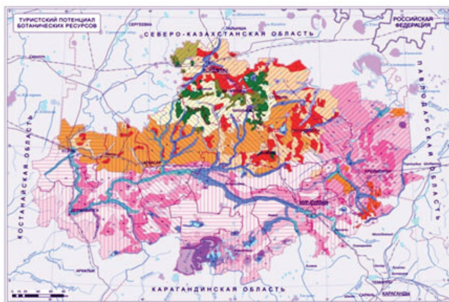
Рисунок 1 – Туристский потенциал ботанических ресурсов Акмолинской области