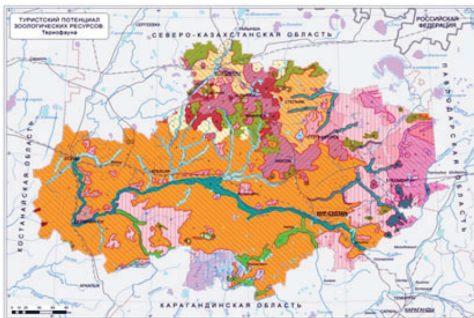
Рисунок 5 – Туристский потенциал териофауны Акмолинской области