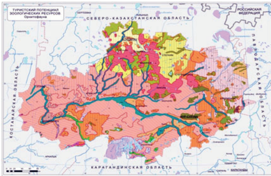
Рисунок 3 – Туристский потенциал орнитофауны Акмолинской области