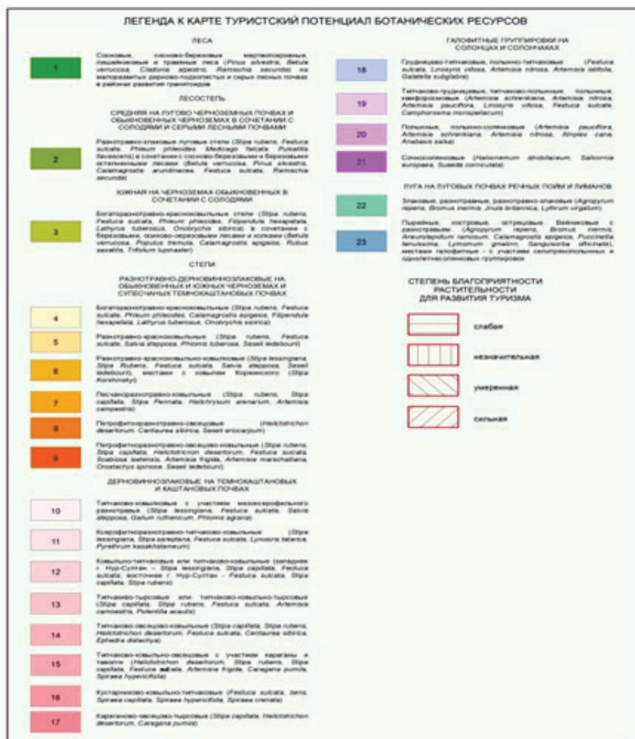
Рисунок 2 – Легенда к карте «Туристский потенциал ботанических ресурсов Акмолинской области»

парка; Сандыктауское учебно-производственное лесное хозяйство; РГП «Жасыл Аймак», филиал Северного региона республиканского лесного селекционного центра; ТОО «КазНИИЛХ» АО «НАНОЦ» Министерства сельского хозяйства РК; Акмолинский областной филиал АО «КазАвтоЖол» и Астанинская дистанция защитных лесонасаждений АО «НК «КТЖ» [5].