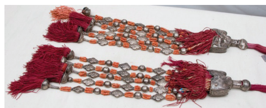
Рисунок 4 – Суйсал. КП 3459-229 КНМИИ им. Г. Айтиева