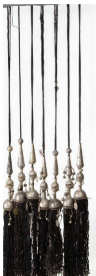
Рисунок 1 – Эшме . КП 5226-705 КНМИИ им. Г. Айтиева

Схожую конструкцию, но иную форму имеет идентичное украшение, приобретенное у мургабских кыргызов в Таджикистане. Оно состоит из узорно штампованных полых металлических пластинок прямоугольной, круглой, конусообразной формы, украшенных зернью. Эти фигуры нанизаны в определенной последовательности на черные шелковые шнуры, оканчивающиеся кистями (рисунок 2, б). Данное украшение считается нетрадиционным, тем не менее, каждый металлический элемент этого украшения в отдельности имеет аналоги в других украшениях кыргызов, бытовавших на юге, поэтому нельзя с уверенностью утверждать, что это украшение изготовлено не кыргызским мастером. Хотя К.И. Антипина в своей работе пишет: «Наконечные украшения типа чач папик и ангуш не являются исконно кыргызскими. Редко когда они изготовлялись кыргызскими мастерами, чаще их приобретали у узбекских и таджикских ювелиров» [1, с. 260]. Что касается названия, то слово ангуш скорее всего было заимствовано из таджикского языка, где оно имеет весьма богатую базу значений, одно из которых звучит как – верх , по верху чего-либо.