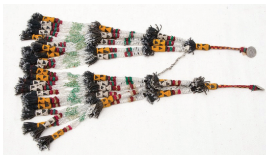
Рисунок 3 – Чач мончок. КП 5338-799 КНМИИ им. Г. Айтиева

Интересна разновидность суйсал , из собрания КНМИИ им. Г. Айтиева, представляющая собой уплощенный купол из штампованных металлических пластинок, из-под которого вместе с красными шелковыми шнурами выходят несколько длинных коралловых низок, дополненных серебряными бусинками и штампованными фигурками – бастыргыч (рисунок 4). Красный цвет этих кистей и обилие кораллов указывают на то, что данное украшение предназначалось молодой женщине, так как его