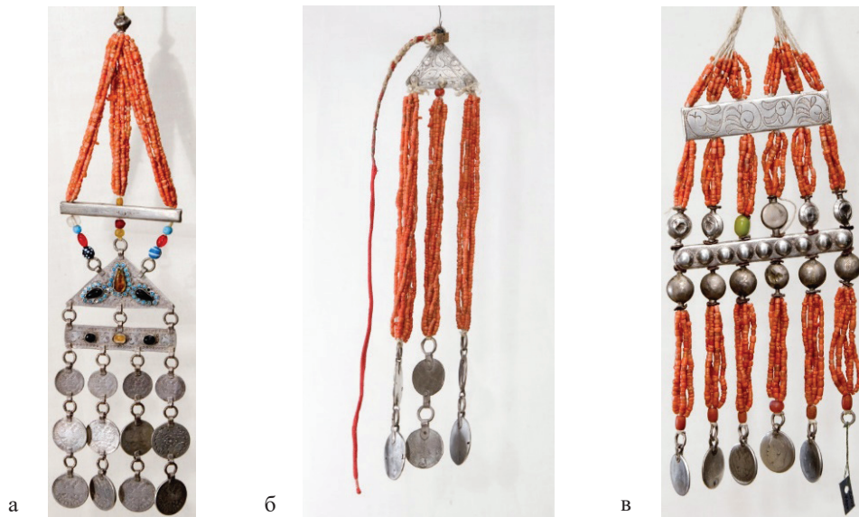
Рисунок 6 – Чач учтук (а). КП 5818-995 КНМИИ им. Г. Айтиева; Чач учтук (б). КП 7404-2003 КНМИИ им. Г. Айтиева; Чач учтук (в). КП 8706-2326 КНМИИ им. Г. Айтиева