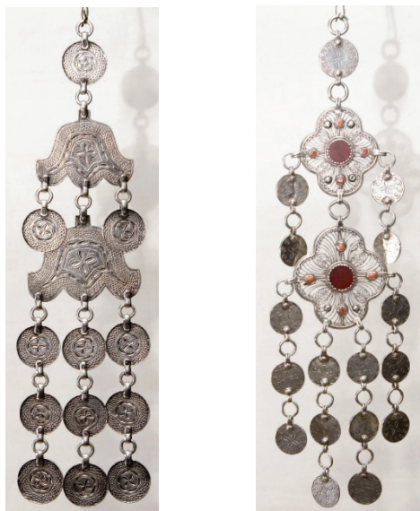
Рисунок 5 – Чолту (а). КП 3540-275 КНМИИ им. Г. Айтиева; Чолту (б). КП 7625-2100 КНМИИ им. Г. Айтиева