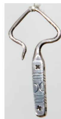
Рисунок 5 – Цельнокованные серьги самсоко . КП 5281-760 КНМИИ им. Г. Айтиева