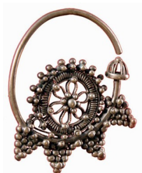
Рисунок 3 – Кольцевые серьги кашгар сырга (зере балдак). КП 5266-745 КНМИИ им. Г. Айтиева

Плоские серьги – жалтак сырга . Также как и объемные, их выковывали вместе с дужкой из цельного прута, но основу сплющивали, придавая ей геометрическую или фигурную форму. Иногда эту