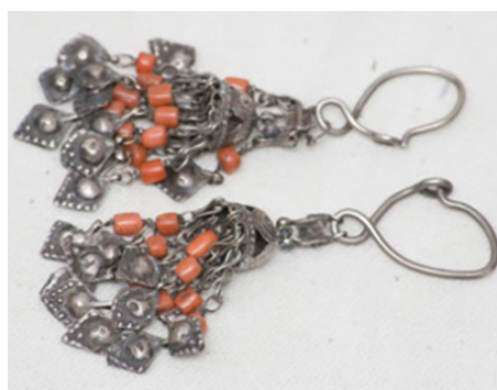
Рисунок 2 – Кольцевые серьги махмеди . КП 6707-1164 КНМИИ им. Г. Айтиева