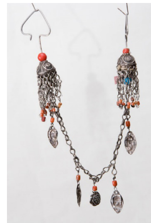
Рисунок 9 – Стержневые серьги сагак сөйкө . КП 3473-243 КНМИИ им. Г. Айтиева