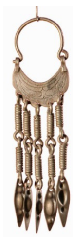
Рисунок 4 – Кольцевые серьги жети аяк . КП 4313-524 КНМИИ им. Г. Айтиева