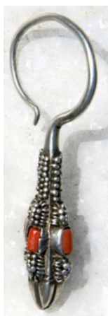
Рисунок 6 – Цельнокованные серьги көз койгон сырга. КП 15358-3387 КНММИИ им. Г. Айтиева