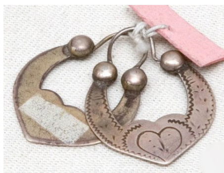
Рисунок 1 – Кольцевые серьги ай сырга . КП 6705-1162 КНМИИ им. Г. Айтиева