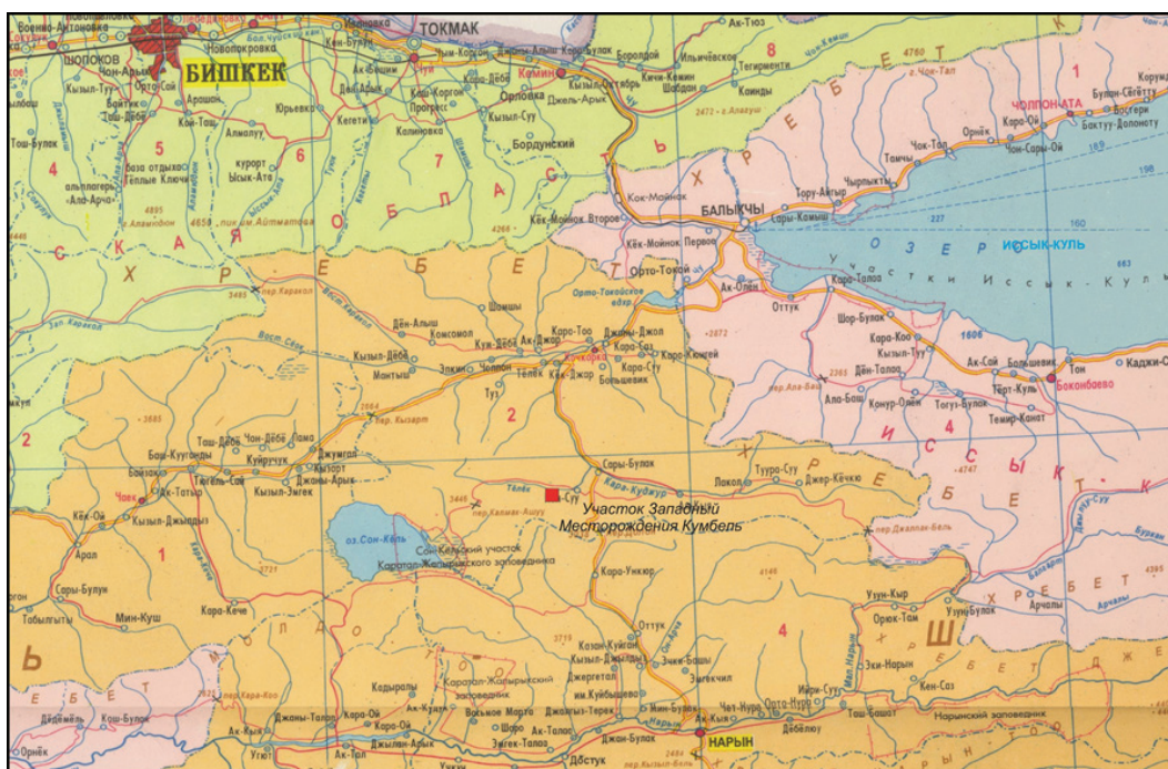
Рисунок 1 – Карта месторасположения участка Западный месторождения Кумбель

Вторая разновидность скарных образований – секущие жильные тела, установленные как в гранодиоритах, так и в породах кровли. Жильные скарны приурочены к разрывным нарушениям северо-восточного направления. Их мощность до 2 м, размер по простиранию – до 16 м. В породах кровли жильное скарное тело имеет мощность 10 м, прослеживается на 50 м севернее основной скарновой залежи (см. на чертеж № 2 – зона разлома северо-восточного простирания № 3). С глубиной мощность жильных скарнов сокращается до первых метров [3, 4].