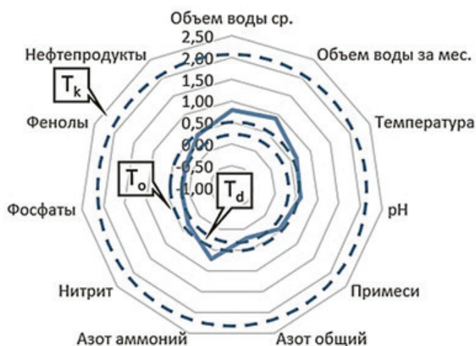
Рисунок 4 – Мультифрактальный фазовый портрет динамик физико-химических показателей сточных вод после биологической очистки

объемах производства льноволокна мы будем иметь и существенные объемы сточных вод. Что означает важность выбора наиболее рентабельного и экологичного метода их очистки.