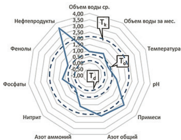
Рисунок 2 – Мультифрактальный фазовый портрет динамик физико-химических показателей сточных вод, поступающих для очистки

Таким образом, можно сделать вывод об эффективности и устойчивости процесса биологической очистки сточных вод (рисунок 4).