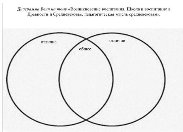
Рис. 3. Диаграмма Венн на тему «Возникновение воспитания. Школа и воспитание в Древности и Средневековье, педагогическая мысль Средневековья»

Задание заключается в следующем: круг предполагает наглядное представление некоторого понятия. Необходимо найти признаки сходства и различия.