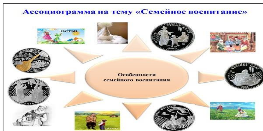
Рис. 2. Ассоциограмма на тему «Семейное воспитание»

Применение технологии развития критического мышления на семинарских занятиях по педагогике: