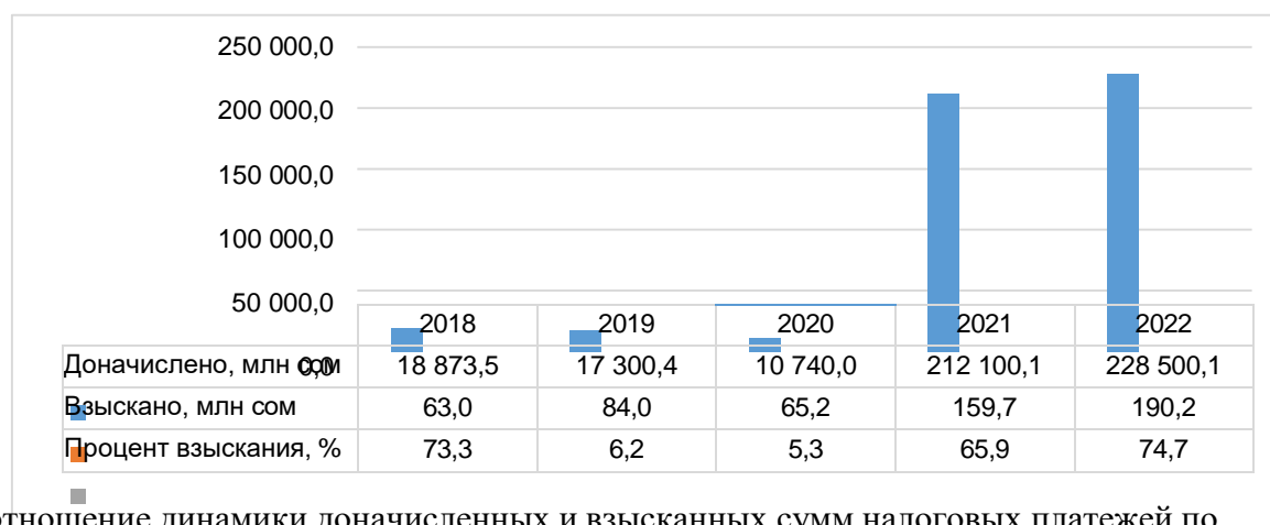
Рис. 2. Соотношение динамики доначисленных и взысканных сумм налоговых платежей по

Однако не все доначисленные суммы фактически поступают в бюджет, что может свидетельствовать о несовершенстве системы и возможных проблемах с взысканием долгов. Необходимо учитывать этот факт при планировании бюджета и принятии финансовых решений.