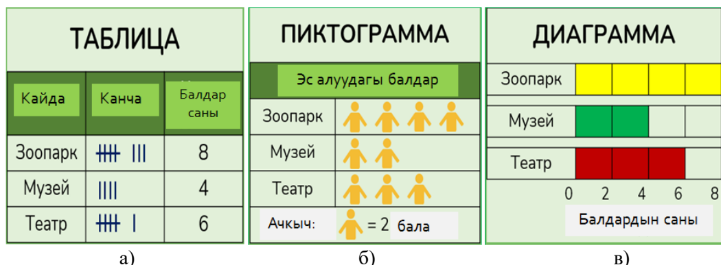
2-сүрөт. Таблицанын берилиш жолдору: а) эсептөө же сандык таблица, б) пиктограмма менен берилген таблица, в) диаграмма менен берилген таблица

Таблицадагы сапчалардын жана мамычалардын мазмунун, диаграмманын горизонталдык жана вертикалдык жазууларын изилдеп, окуучулар таблицадагы/диаграммадагы маалыматтарды окуп, анда берилген маалыматка байланыштуу суроолорго жооп бере алышат.