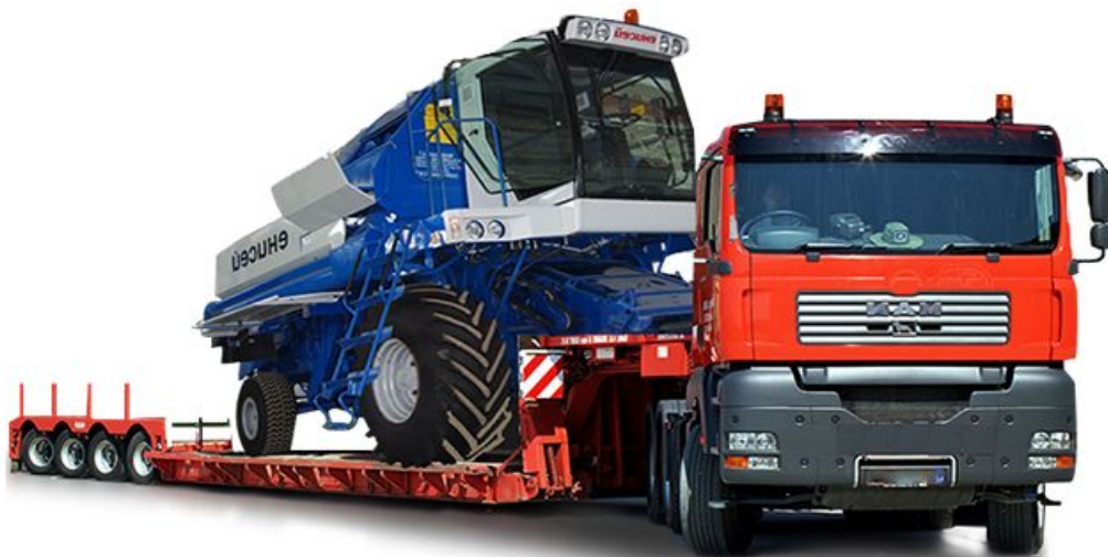
1-сүрөт. Ири өлчөмдөгү жүктөрдү ташуу

Акыркы мезгилдерде дүйнөлүк өнөр жай тармагынын өнүгүү тенденцияларын карап көрсөк, ири өлчөмдөгү жана оор салмактагы ар кандай агрегаттар, түзүлүштөр өндүрүлүүдө. Тагыраак айтканда бул өндүрүлгөн түзүлүштөр, агрегаттар массалары, чен өлчөмдөрү, октогу түшкөн жүктөрү боюнча көрсөтүлгөн нормадан ашып ташуу учурунда бир топ онтойсуздукту пайда кылат. Өзгөчө, мамлекетибиздин өйдө карай, кайра ылдый түшкөн жол жабылмалары начар жолдордо, толуу шарттарында мындай жүктөрдү ташуу өзгөчө адискөйлүктү талап кылат. Төмөндөгү 1-сүрөттө ири өлчөмдөгү жүктөрдү ташуу учуру көрсөтүлгөн.