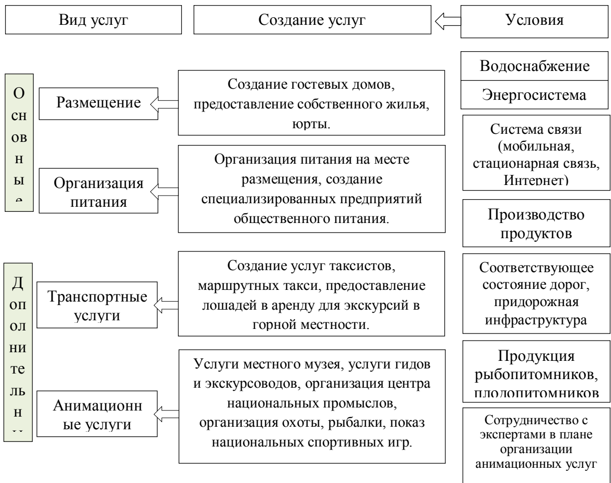
Рис.2. Схема формирования турпродукта в рамках муниципального образования

Реализация на практике вышеперечисленных туристических услуг в виде бизнес – проектов для развития туристической деятельности на территории муниципального