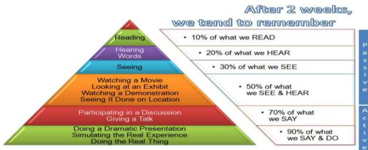
Passive and active learning diagram (Edgar Dale's cone of experience http://teachernoella.weebly.com/dales-cone-of-experience.html )

Бул көндөмдөр окуучуларга билимди гана эмес башкаларды угуу, ар кандай көз караштарды баалоо, талкууларга катышуу, биргелешкен чечим кабыл алуу, толеранттуулукту өнүктүрүү ж.б. , коммуникативдик көндүмдөрдү да өнүктүрүүгө түрткү берет. Заманбап изилдөөлөр көрсөткөндөй, интерактивдүү окутуу окуучуга жаңы материалды оңой эле өздөштүрүп тим болбостон, аны узак убакытка эстеп калууга жардам берет. Төмөнкү диаграммада пассивдүү окутуу аркылуу окуучу материалдын 30% гана эске кабыл ала ала тургандыгы ачык көрүнүп турат, ал эми интерактивдүү окутуу бизге алынган маалыматтын 90% эске алууга мүмкүндүк берет (1-сүрөт).