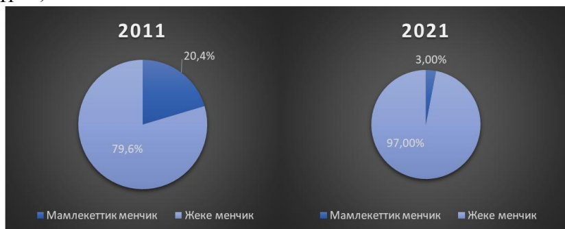
2 – сүрөт. Булак КРнын Улуттук Статистика Комитети: http://www.stat.kg/ [6].

90-жылдары айыл чарбасында башталган жер реформасынын натыйжасында агрардык өндүрүштүн негизги каражаттары - жерлер, айыл чарба техникалары жана жабдуулар, мал менчиктештирилген. Бирок, жүргүзүлгөн реформалар күтүүлөрдү актаган жок: мамлекеттин ойлонуштурулбаган саясаты бул стратегиялык тармактын чарба жүргүзүүнүн накталай жана майда товардык формага айлануусуна алып келди. 2011-жылы бардык айдоо аянтынын 79,6%ы жеке менчикте, калган 20,4%ы - мамлекеттин менчигине өткөн. Азыркы учурда айыл чарбасынын 97%дан ашык продукциясы жеке сектордо өндүрүлөт. (2-сүрөт)