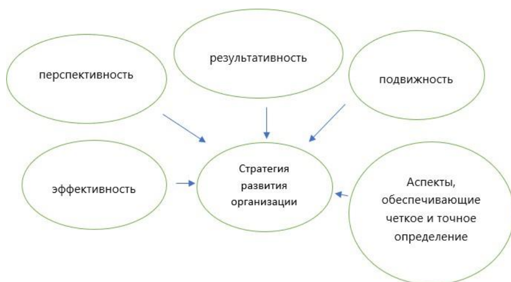
Рисунок 1. – Основные принципы стратегии развития организации Реализация принципов диктуется необходимостью учета следующих условий:

Следовательно, большая часть авторов определяет стратегию как процесс проектирования для применения имеющихся у организации средств и обеспечения их результативного использования. Суммируя теоретические аспекты теории стратегического управления, необходимо обозначить основные принципы развития организации (рис. 1)