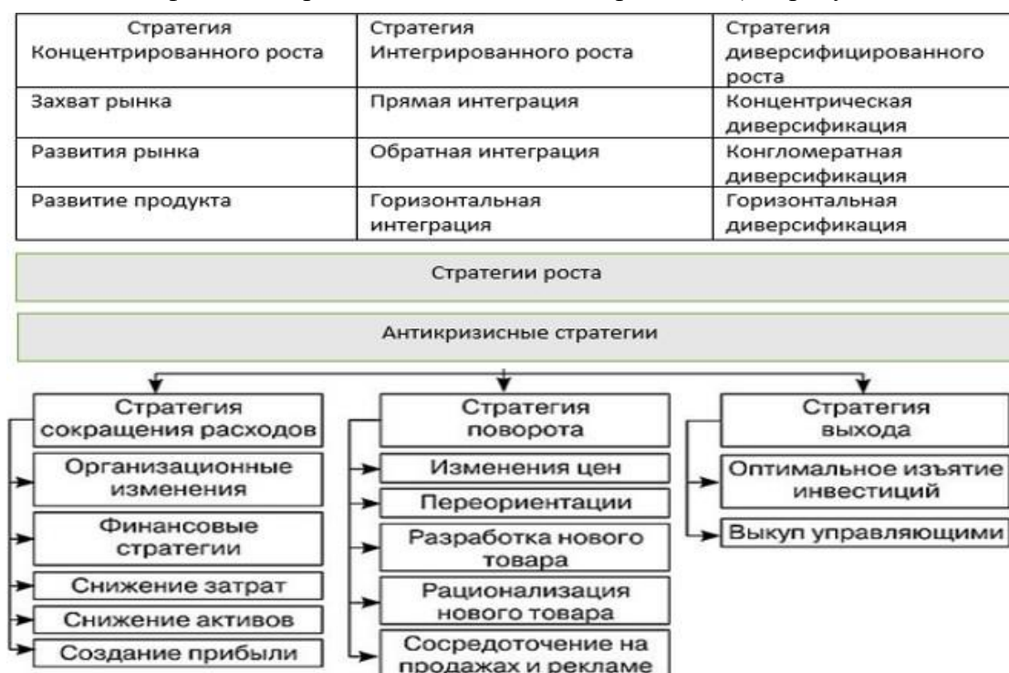
Рисунок 3. – Классификация стратегий экономического развития

Поведение фирмы в различных окружениях определяется её жизненным циклом. В современной литературе по стратегическому управлению выделяются различные виды стратегий организаций. Стратегии роста активно применяются, когда организация увеличивает производство, привлекает новых клиентов и активно улучшает свою продукцию или услуги. В случае необходимости сокращения масштабов производства и оптимизации расходов организации прибегают к антикризисной стратегии. Далее приведена классификация стратегий экономического развития (см. рисунок 3).