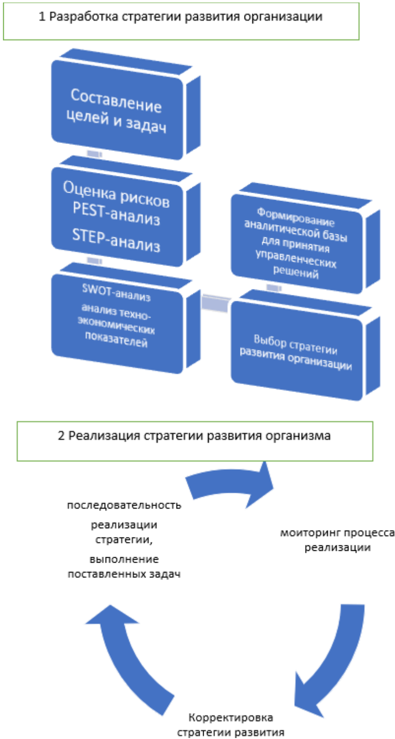
Рисунок 4. – Алгоритм разработки и реализации стратегии развития организации

Разработка и реализация стратегии долгосрочного развития компании представляет собой комплексный и гибкий механизм, который требует внимательного анализа внутренних ресурсов и возможностей компании, а также учета внешних факторов среды, включая экономические, политические, социокультурные и технологические аспекты. При выборе оптимальной стратегии необходимо учитывать специфику отрасли, в которой действует компания, так как каждая отрасль имеет свои особенности и требует