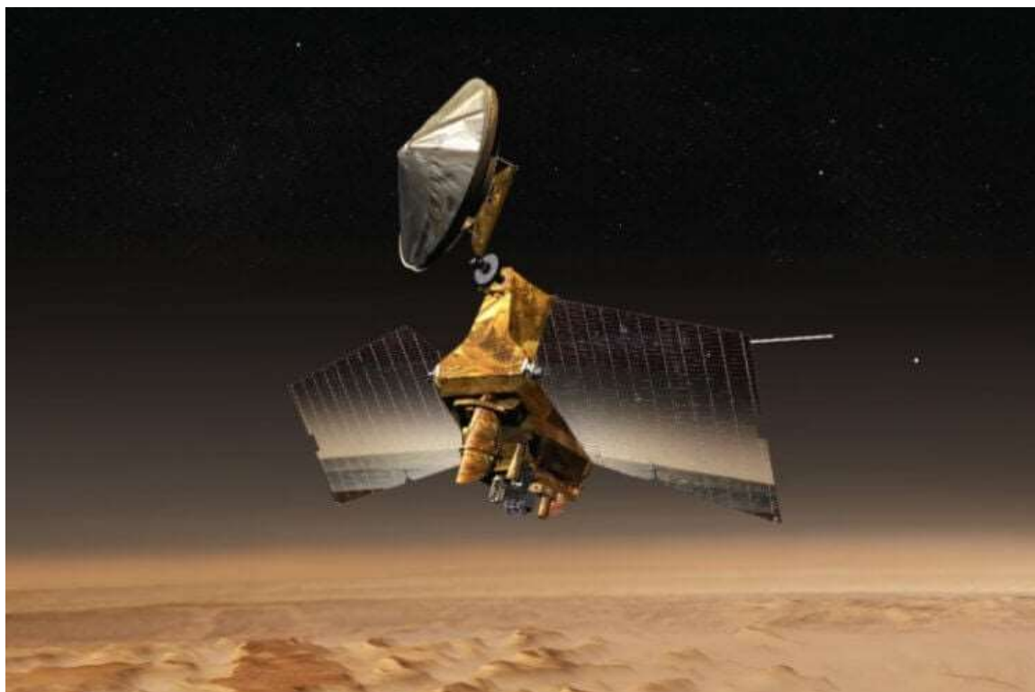
Рисунок 4. Спутник Mars Reconnaissance Orbiter

Mars Reconnaissance Satellite (4-рис.) показало, что в глубинах Красной планеты, как и на Земле, есть тектонические плиты. Они постоянно находятся в движении и иногда сталкиваются друг с другом, что приводит к ударам. Движение и столкновение тектонических плит являются основной причиной марсианских землетрясений.