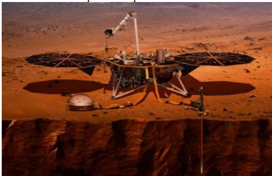
Рисунок 1. Аппарат InSight для исследования марсианских землетрясений

быть использованы в качестве одной из крупнейших коллекций для обнаружения пылевых вихрей на Марсе.