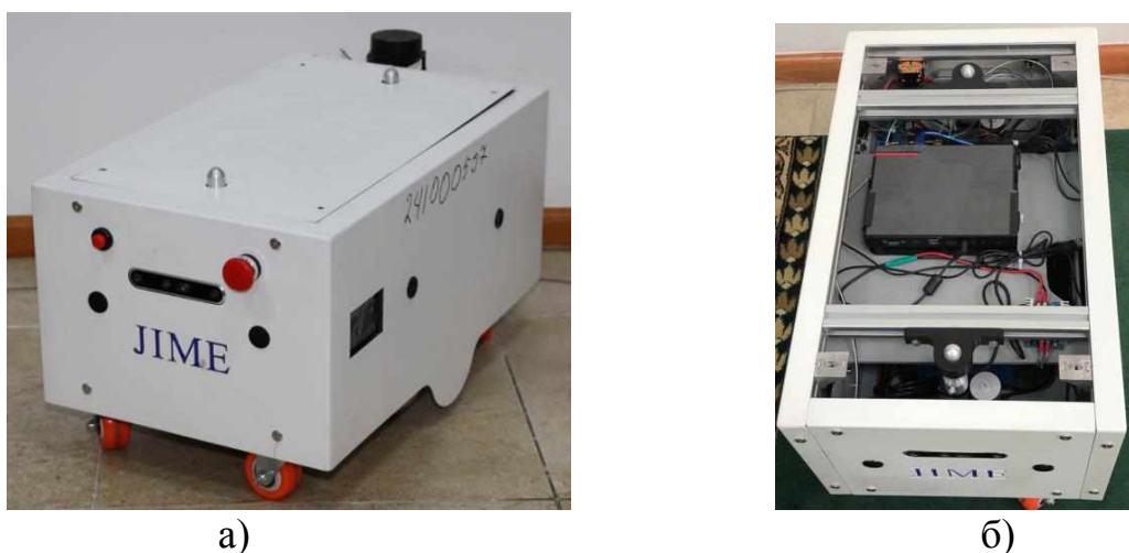
Рисунок 1. Экспериментальный образец транспортного робота; а – фотография робота с внешней обшивкой; б – фотография робота без верхней крышки

Транспортный робот имеет автономную навигацию и обладает способностью преодоления препятствий и планирования маршрута. На рисунке 1 показан экспериментальный образец транспортного робота с 2-мя ведущими колесами и 4-мя поворотными колесами.