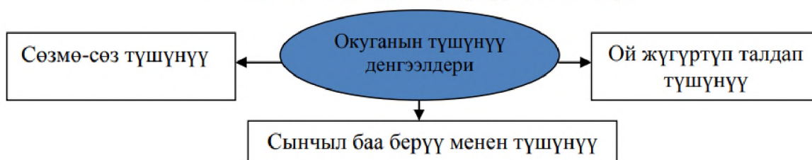
Таблица 1. Окуганын түшүнүү деңгээлдери