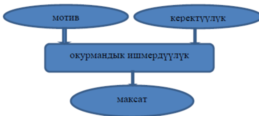
Сүрөт 1.1. – Окурмандык ишмердүүлүктүн байланыштары

Окуучу өз курагына, кызыгууларына жараша окуу программасына ылайык түзүлгөн окуу китебиндеги, класстан тышкаркы окуу үчүн хрестоматиядагы, өз алдынча окуу үчүн көркөм адабияттардагы тексттерди аң-сезимдүү окуп чыгып, аларды түшүнүп, талдап, баа берип, көркөм сөз каражаттарын түшүнүп, алган билимдерин турмушунда колдоно билүүгө жетишиши зарыл экендиги окурмандык ишмердүүлүктүн башкы талабы болот.