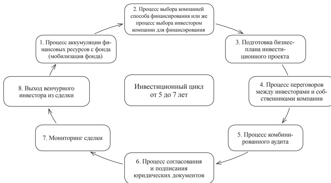
Рисунок 3 – Технология венчурного инвестирования

в форме дохода на вложенный капитал или прироста капитала) и минимизации инвестиционных издержек и рисков.