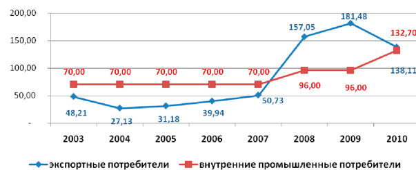
Рисунок 2 – Динамика тарифов на электрическую энергию, реализуемую на экспорт ОАО “Электрические станции” и конечный тариф внутренним промышленным потребителям за 2003–2010 гг.

В то же время тарифы для конечных промышленных потребителей на внутреннем рынке устанавливаются правительством Кыргызской Республики и являются стабильным показателем. В течение многих лет это цена не изменялась и лишь 2010 г. произошло резкое ее увеличение для