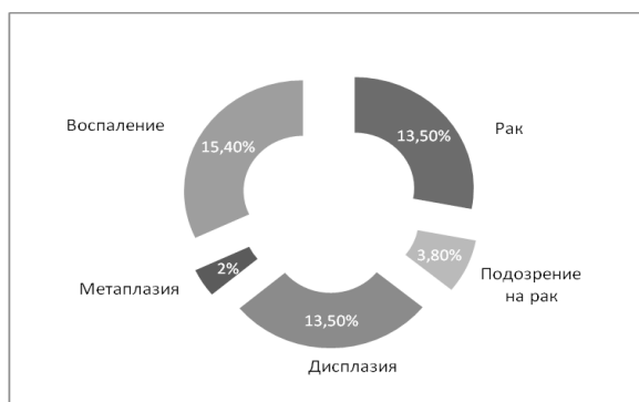
Рисунок 3 – Структура цитологической патологии в обследованной группе

2. Ткани пищевода, имеющие предопухолевые и опухолевые изменения при использовании 5%-ного р-ра Люголя не окрашиваются, в то время как участки нормальной слизистой окрашиваются в коричневый цвет.