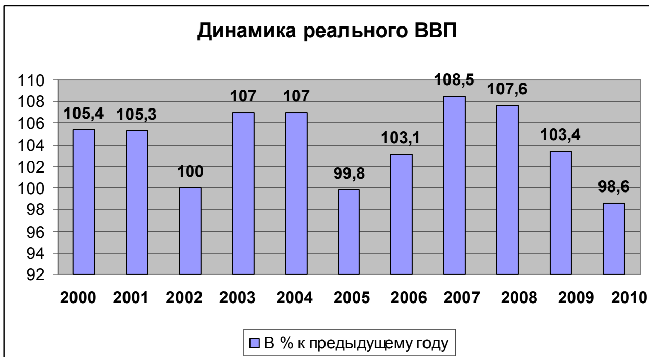
Рис. 1. Динамика валового внутреннего продукта

По данным Национального статистического комитета Кыргызской Республики, в 2000 году в текущих ценах было произведено ВВП в объеме 65 млрд сомов, в 2009 году этот показатель увеличился в 3 раза и составил 196 млрд сомов.