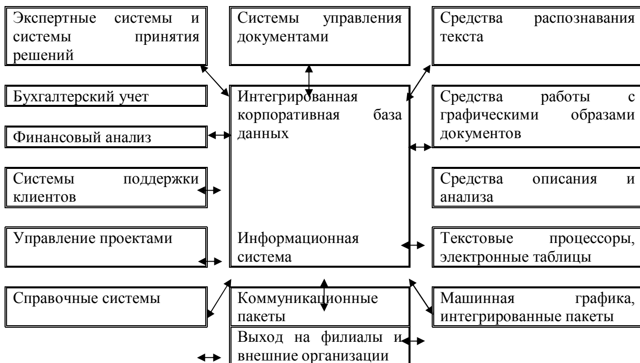
Рис. 1. Современная информационная система организации

Современные компании применяют информационные технологии для совершенствования методов работы. В результате изменяется организационная структура компаний, разрабатываются новые организационные взаимосвязи, которые ранее экономически были невозможны.