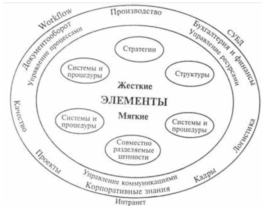
Рис. 1. Место и назначение информационных технологий

Корпоративное управление и создание корпоративных информационных систем в настоящее время опираются на различные информационные технологии, так как, к сожалению, не существует универсальной технологии. Можно выделить следующие три группы методов управления: ресурсами, процессами, корпоративными знаниями (коммуникациями). Среди информационных технологий в качестве наиболее используемых можно выделить следующие: СУБД, Workflow (стандарты ассоциации Workflow Management Coalition) Интранет. На рис. 1 показаны место и назначение каждой из информационных технологий /3/.