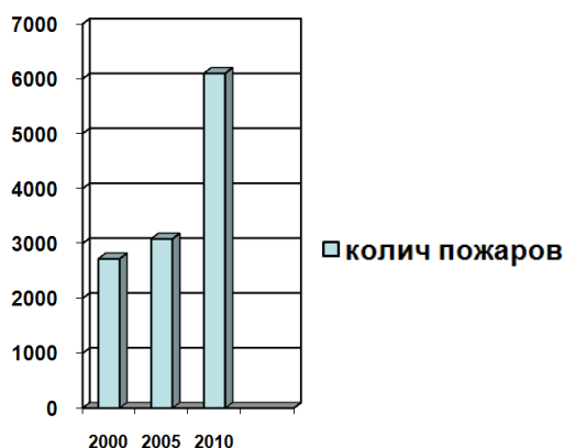
Рисунок 1 – Количество пожаров

В условиях пожара дерево, а также композиционные полимерные материалы подвергаются термическому разложению с выделением паргазовой смеси сложного состава и образованием пористого кокса. Это приводит к потере их прочности и жесткости. Для стали характерно