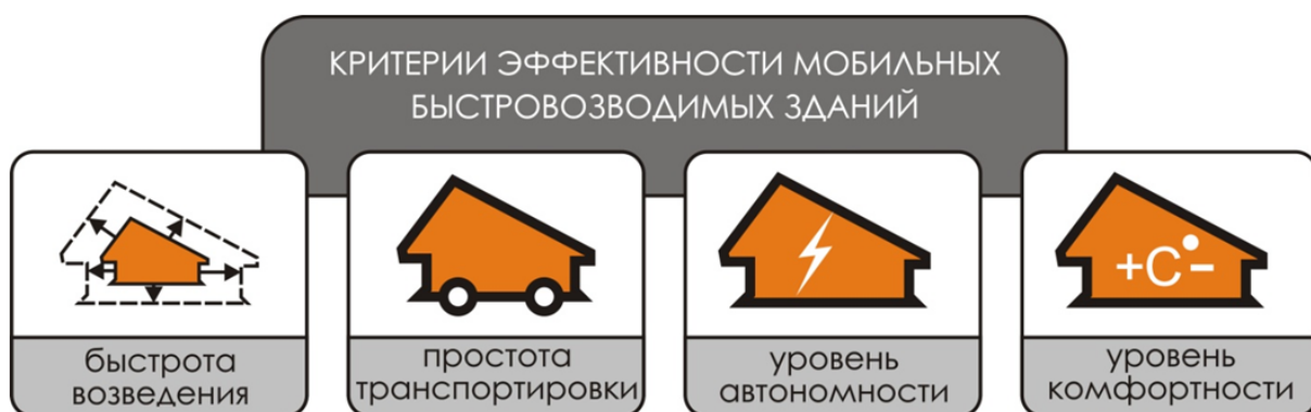
Рисунок 4 – Критерии эффективности мобильных быстровозводимых зданий