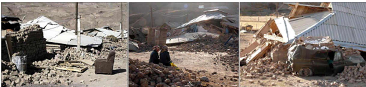
Рисунок 1 – Фото последствий землетрясения в селе Нура Алайского района Ошской области

Ошской области, унесшее жизни семидесяти пяти человек из девятистот жителей села (рисунок 1). Сила подземных толчков достигла 8 баллов, в результате чего 121 из 211 домов были разрушены. Министерство чрезвычайных ситуаций приняло решение о возведении 130 быстровозводимых домов легкой конструкции, которые помогли людям пережить зиму [1].