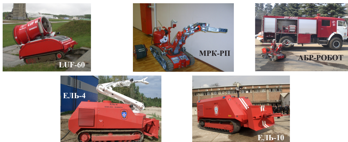
Рисунок 2– Общий вид пожарных РТС, находящихся на оснащении ВНИИ ПО МЧС России