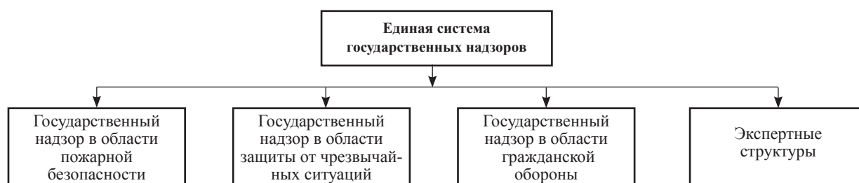
Рисунок 1 – Структура единой системы государственных надзоров

➤ подразделения, осуществляющие экспертную деятельность в области гражданской обороны, предупреждения чрезвычайных ситуаций природного и техногенного характера, обеспечения пожарной безопасности (экспертные структуры) [2]. Структура единой системы государственных надзоров МЧС России представлена на рисунке 1.