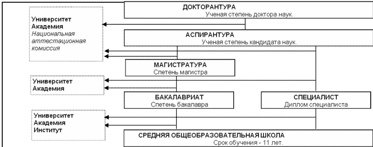
Система высшего образования Кыргызской Республики представлена на рис 1

Впервые в истории высшего образования КР было создано государственно-частное высшее учебное заведение в состав которого вошли следующие подразделения (Схема №2)