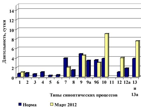
Рисунок 1 – Многолетние средние (нормы) и фактическая суммарная продолжительность типов синоптических процессов в марте

Осадков в Чуйской долине выпало около нормы, их количество колеблется от 44 мм в Жаны-Жере до 61 мм в Иссык-Ате, в целом отношение осадков к многолетней норме составило 78–118 % (таблица 1). Всего за месяц осадки