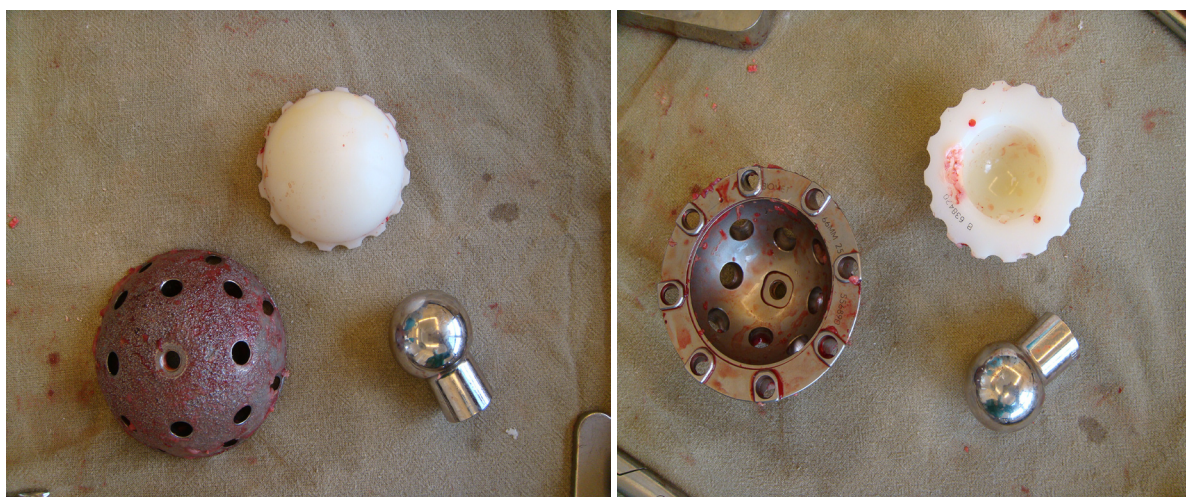
Рис. 3, 4. Интраоперационные рисунки пациентки Ш. Удаленный ацетабулярный компонент, головка и полиэтиленовый вкладыш

остеопластического костного трансплантата. В дальнейшем при исследовании через 6 мес. отмечали снижение накопления РФП в данной зоне, к первому году с момента операции накопление РФП в зоне операции было равно таковому в неоперированном суставе. Производилась оценка функционального результата по шкале Харриса через 6, 12, 24, 36 и 48 мес. после операции.