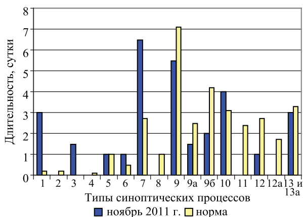
Рис. 1. Многолетние средние (нормы) и фактическая суммарная продолжительность типов синоптических процессов в ноябре

Погодные условия Чуйской долины в ноябре 2011 года определяли 11 типов синоптических процессов (1, 3, 5, 6, 7, 9а, 9б, 9, 10, 12 и 13) из 16 возможных (рис. 1). При этом наибольшую интегральную длительность имела волновая деятельность (тип 7) – 6,5 суток, что в 2,4 раза выше нормы. Западное вторжение (тип 10) фиксировалось в течение 4 суток, что превысило норму в 1,3 раза. Повторяемость северного вторжения (тип 6) была выше нормы в 2 раза, хотя оно наблюдалось всего одни сутки. При незначительной длительности южных циклонов в ноябре (норма 0,4 суток) длительность типов 1 (южнокаспийский циклон) и 3 (верхнеамударьинский циклон) составила 4,5 суток. Северо-западное вторжение (тип 5) наблюдалось в пределах нормы – 1 сутки. Юго-западная, южная, юго-восточная периферии антициклона и предфронтальное положение (типы 9, 9а, 9б и 13) в сумме наблюдались 9 суток, что в 1,7 раза меньше нормы.