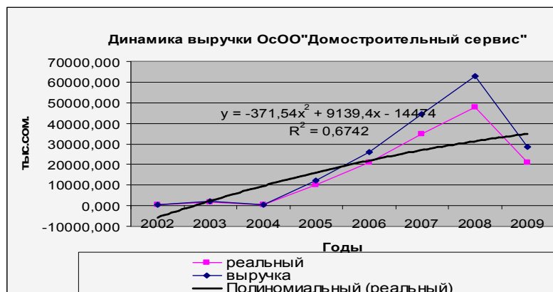
Рис 1. Динамика выручки ОсОО «Домостроительный сервис» /5/

прогнозирования роста объема работ. Но при нынешнем состоянии мирового финансового кризиса применение трендовых моделей недопустимо.