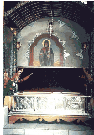
Рака с мощами

В ноябре 1995 г. Указом Священного Синода Украинской Православной Церкви архиепископ Лука был причислен к лику местночтимых святых. А 20 марта 1996 г. в Симферополе мощи Святителя Луки были перенесены с кладбища у Всехсвятской церкви крестным ходом в Свято-Троицкий собор. Каждое утро, в 7 часов утра, в кафедраль-