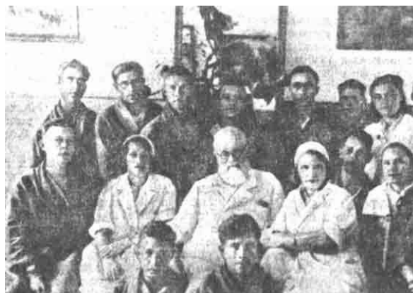
Владыка с коллегами и ранеными

Состояние епархии было ужасным. По всей Сибири осталась незакрытой одна кладбищенская церковь (Новосибирск). В начале марта 1943 г. после усиленных хлопот Святитель добился открытия маленькой кладбищенской церкви в слободе Николаевка (предместье Красноярска), где он и служил. При постоянном давлении властей на Церковь, он старался навести порядок в епархии, и сумел прекратить раскольническую деятельность обновленцев.