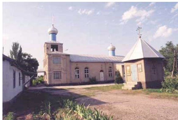
Храм в с. Ново-Покровка