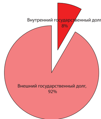
Рис. 1. Структура государственного долга КР на 01.12.2006.

конец декабря 2006 г. Наибольший удельный вес составлял внешний государственный долг – 91,53%, соответственно на внутренний государственный долг приходилось 8,47% [2].