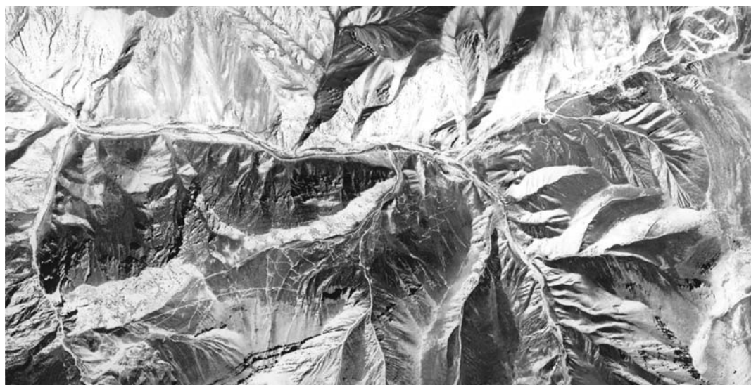
Рис. 2. Общий вид поверхности месторождения Кара-Кече в районе выходов угольного пласта по данным аэрофотосъемки.