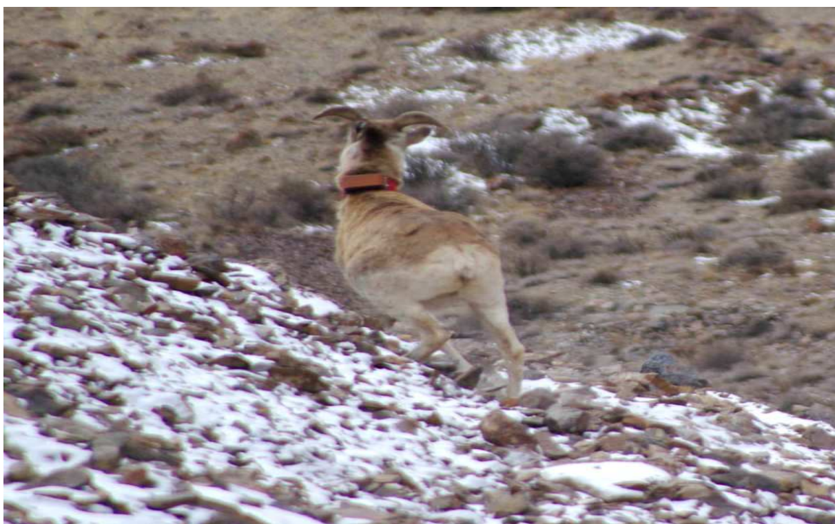
Фото.2. Бермет - самка, на которой установлен первый спутниковый ошейник.

ответом на вопросы, которые являются «белым пятном» для ученых Кыргызстана, т.е. будет дан ответ на вопрос о миграционных путях – где у животных находятся летние и зимние пастбища, где происходит гон, где находятся «родильные дома», где с малышами летом укрываются от хищников, а также много другого. Это первый шаг для научного подхода к охране и восстановлению их численности, для установления мест с целью показа животных туристам и даже для дальнейшего использования их в качестве объекта для иностранной трофейной охоты. Я это говорю потому, что, по нашему плану, мы должны проследить не только за самками, но и за самцами и за молодыми архарами, т.е. выбираем и по полу, и по возрасту ( все поло-возрастные структуры архара - самцы, самки, подростки, сеголетки ). Все они будут под контролем в течение всего года. Для этого мы планируем в общей сложности установить 6 спутниковых ошейников в течение 2010 года. В настоящее время один ошейник установлен на самке, которая получила свое персональное имя – Бермет, и от которой уже получена первая информация о ее перемещении (Фото 2).