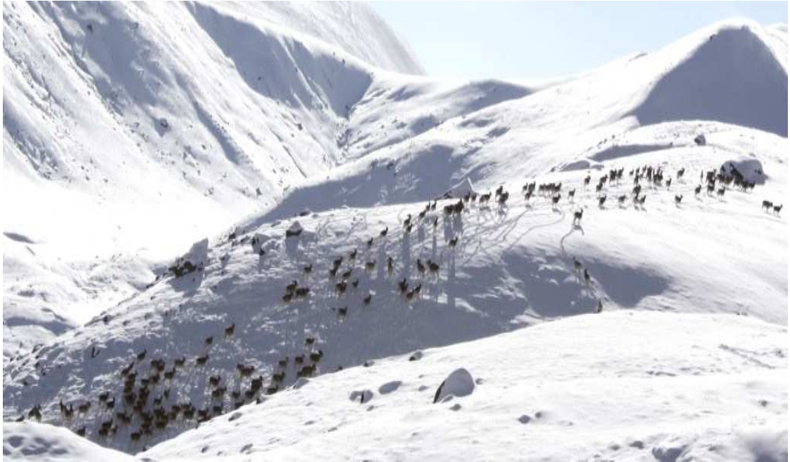
Фото 4. Стадо архаров (170 голов) в Сарычат-Эрташском заповеднике.

Для крупных животных (в том числе архара и барса) нет административных границ. Для архара характерны как вертикальные, так и большие исторически сложившиеся горизонтальные перемещения по территории. Это естественный, веками отработанный механизм ежегодных сезонных переходов архара к местам зимних и летних пастбищ, местам гона и окота, включая и пути переходов к ним. Поэтому выделение территорий охотопользователям, а также проведение охоты должно рассматриваться только исходя из миграционных путей крупных животных (архар, козерог, барс) и «соседства» с ООПТ. Современный подход к выделению территорий для охоты и проведение самой охоты научно совершенно не обоснован и исходит только из практических интересов охотопользователей и лиц, представляющих им эти территории.