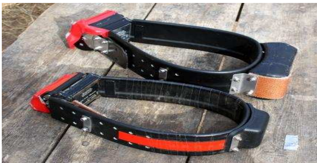
Фото 1. Спутниковые ошейники

Среди современных методов наблюдения за животными спутниковые – самые совершенные и самые дорогие. Наблюдения при помощи спутников дают беспрецедентные данные для исследователей о перемещении животных в природе. Местоположение животного фиксируется спутником каждые 20 или 30 минут и передается сразу на электронную карту. Это действительно фантастика, но которая уже стала реальностью. Этим методом изучаются многие редкие и исчезающие животные: медведи, тигры, барсы и др. Этим методом успешно проводит исследования по барсу Том Мак Карти, под чьим руководством в 2002 году в заповеднике началось изучение и проведение мониторинга барса, архара и козерога, но только с помощью обычного GPS.