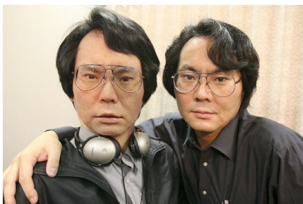
Рис.1. Хироси Исигуро и его робот-двойник [Интернет ресурс]

Известным фактом остается и то, что в 2006 году японский инженер Хироси Исигуро (Hiroshi Ishiguro) изобрел робота – двойника. Андроид представляет собой точную копию ученого.