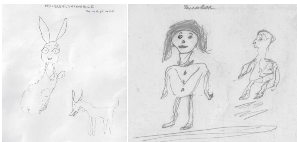
Рис. 3. Примеры изображений нескольких фигур в группе медицинских работников (тест “Нарисуй человека” и “Несуществующее животное”)

Подобный же феномен нами обнаружен в рисунках медицинских работников, которые оказались в чрезвычайных ситуациях, опасных для жизни (события в июне 2010 в г. Ош). Но двойные фигуры были только в тесте “Нарисуй человека” (1,28 %) и в тесте “Несуществующее животное” (3, 8%).