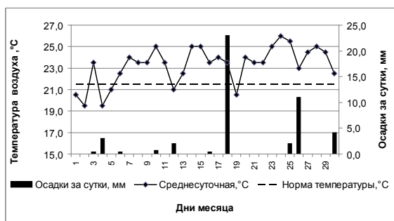
Рис. 2. Месячный ход температуры воздуха и осадков в Бишкеке в июне 2011 г.

тенсивному прогреванию земной поверхности и воздуха. Самые холодные сутки отмечались 4 июня при западном вторжении, температура воздуха в ночные часы была 13–15°C, а днем поднялась только до 21–24°C.