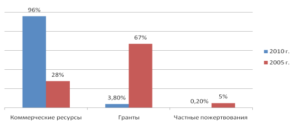
Рис. 1. Изменения в структуре привлеченных финансовых ресурсов микрофинансовыми организациями

чительной части донорской помощи, носившей в большей степени гуманитарный характер, направленный на решение вышеуказанных проблем. Такая же ситуация наблюдалась и с проектами микрофинансирования международных гуманитарных организаций, которые были созданы для оказания социальной помощи и не преследовали коммерческие цели. Они полностью были зависимы от финансирования со стороны международных организаций, которое в основном предоставлялось в виде грантов. Данная ситуация изменилась кардинально начиная с 2004 г. и постепенно доля грантов и безвозмездной финансовой помощи в структуре капитала микрофинансовых организаций сократилась до минимума. Так, в 2010 г. доля коммерческих ресурсов, привлеченных микрофинансовыми организациями для осуществления их деятельности, составила 96% (рис. 1) [1].