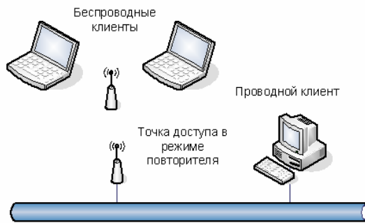
Рис.2. Использование точки доступа в режиме повторителя

Максимальный радиус покрытия точки доступа составляет в офисном помещении 100 м. Но следует учитывать, что передаваемый сигнал при этом достигает беспроводного клиента за счет эффектов дифракции, отражения и рассеяния от стен и окружающих предметов. Плотность потока мощности в местах приема зависит от частоты радиосигнала, увеличиваясь на более низких частотах по отношению к свободному пространству. В этом случае мобильный клиент находится в некоторой так называемой локальной зоне, в которой происходит рассеивание энергии сигнала. Поэтому по мере удаления от точки доступа сигнал слабеет, и скорость обмена снижается. Для работы на максимальных скоростях клиенты должны находиться от точки доступа не дальше 15-20 м. На уровень сигнала оказывают влияние стены, офисные перегородки, мебель, жалюзи и т.п.