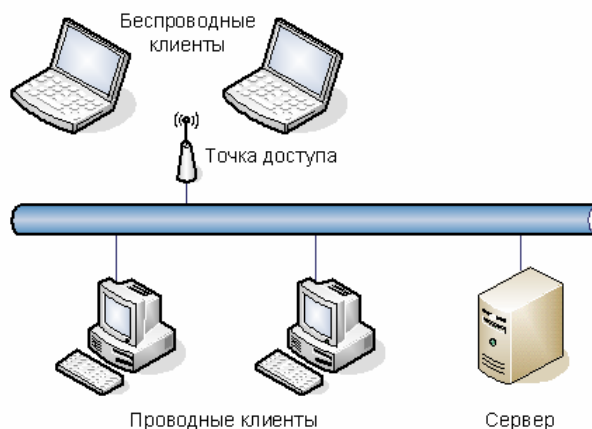
Рис.1. Пример типового использования точки доступа

С точки зрения сетевой архитектуры точка доступа является пассивным устройством (устройством передачи данных). В проводной сети ее аналогом является концентратор – «хаб». Тем не менее, каждая точка доступа должна иметь IP-адрес, который используется для управления. Типичная конфигурация сетевой инфраструктуры с использованием точки доступа приведена на рис. 1.