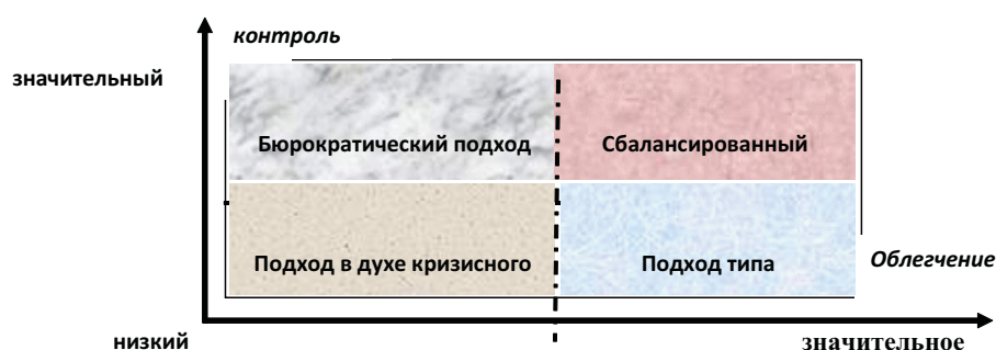
Рис. 2. Матрица соотношения степени контроля и облегчения торговли

Нижний правый квадрант (низкий контроль, значительное облегчение торговли) представляет подход, при котором повседневные операции